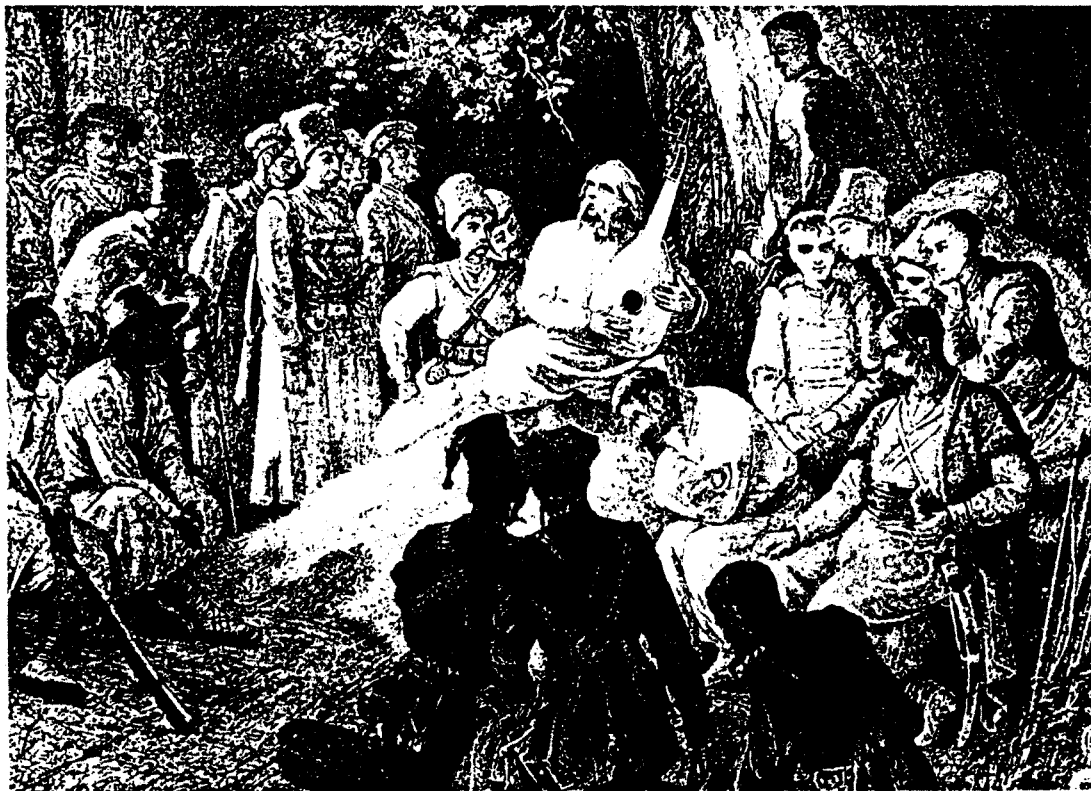
H Aidamaks & Cossacks Listen to a Kobzar — by A. Slastion